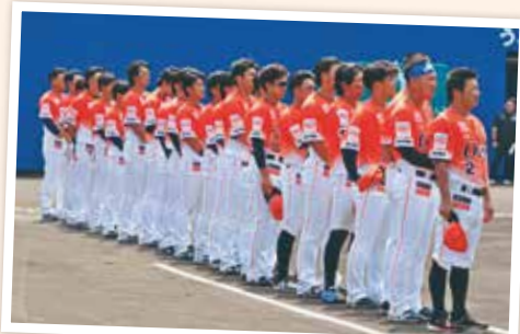
試合前に整列するオイシックス新潟アルビレックスBC