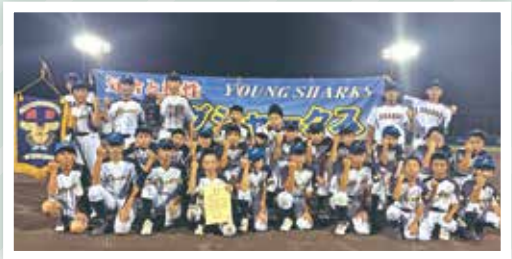
城内ヤングシャークス