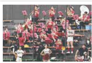
早稲田大学応援部