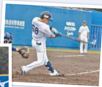
岸のホームランで追加点をあげた