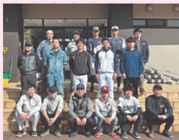
南魚沼市野球連盟

南魚沼市野球連盟、FC Artista、六日町高校テニス部からオープン作業をご協力いただきました。ありがとうございました。