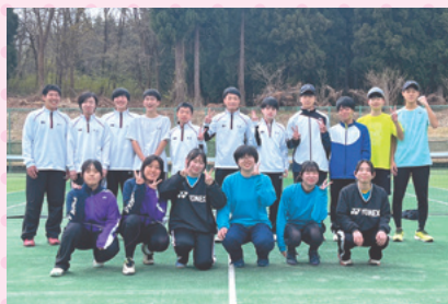
六日町高校テニス部