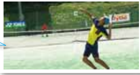
どのコートでものぞいても好ゲームばかりでした

数多くの大会で使用されている大原運動公園のテニスコート。今シーズンも残りわずかになってきました。皆様のご利用お待ちしております。