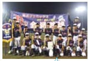
優勝☆ 湯沢フェニックス