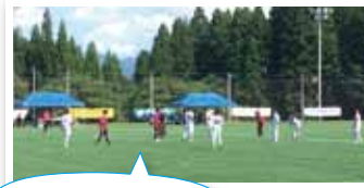
小出高校対六日町高校の地元対決もありました

今年の夏、大原運動公園が第96回全国高校サッカー選手権大会新潟県大会の会場の一つに選ばれ、8月26日、27日の2日間にわたり、多目的グラウンド